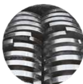
Kés Konfiguráció & Szélesség