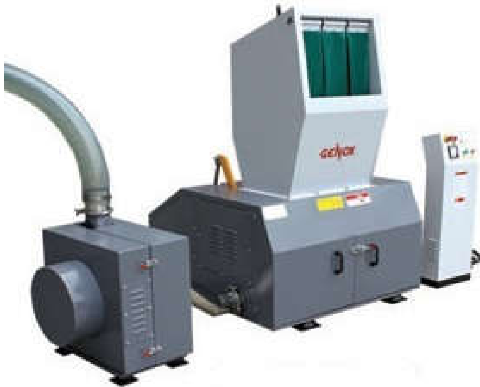
GC600 zajszigetelt változat