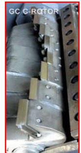
C-Rotor Karom formájú, eltolt forgó kések