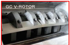
V-Rotor V-alakban elhelyezett forgó kések