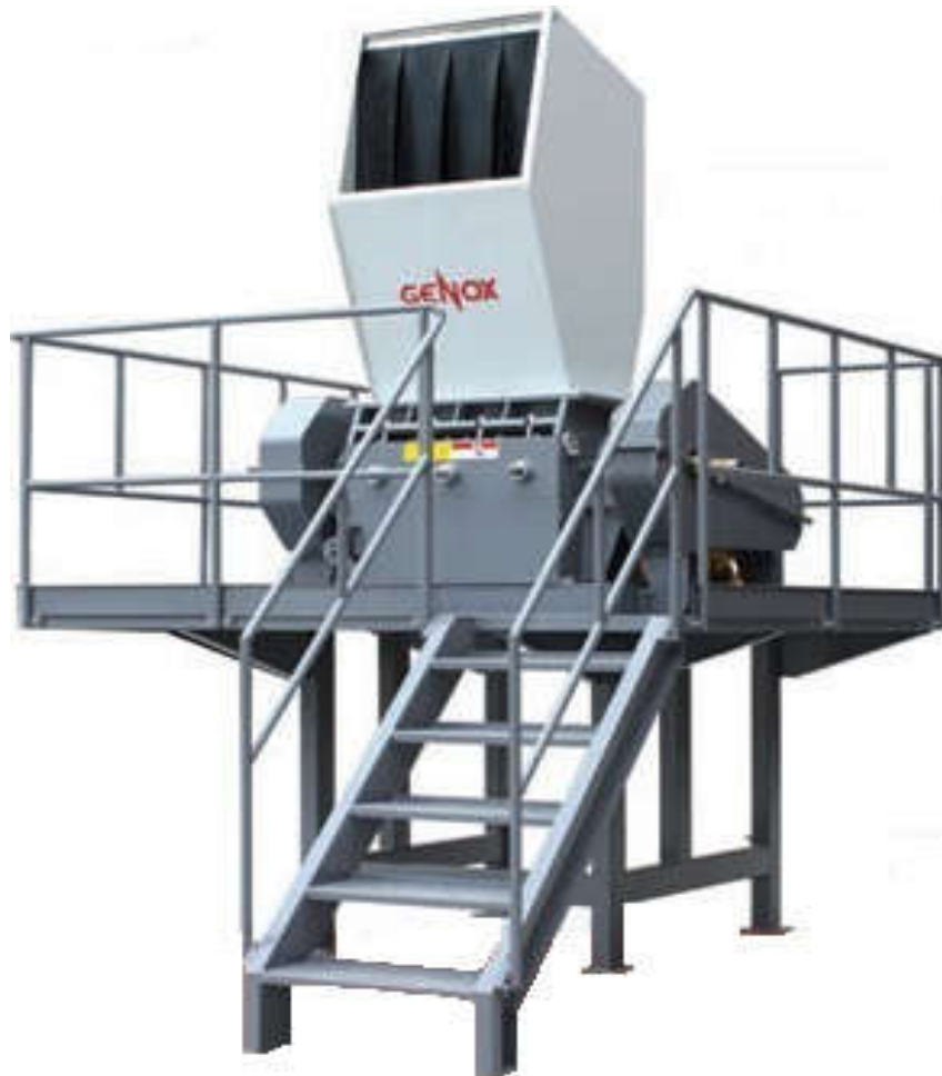
GC600 lendkerékkel és állvánnyal