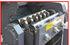
Az állókések pozíciója csavarokkal állítható.