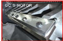
S-Rotor ferdén elhelyezett forgó kések