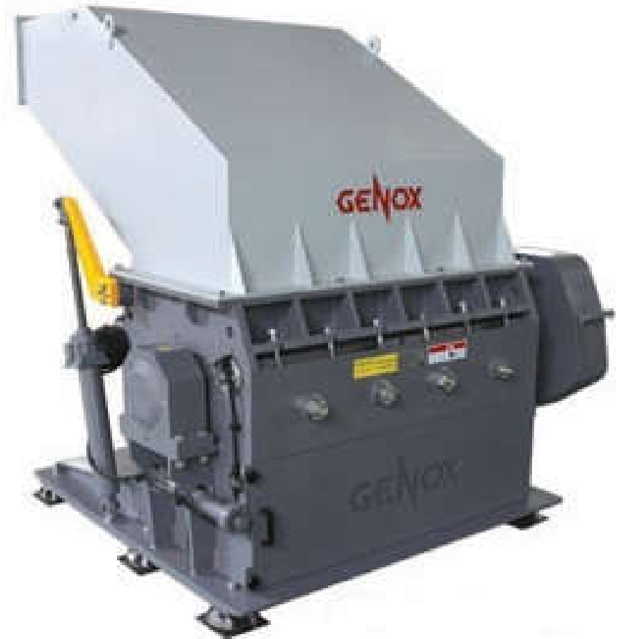
GC1000 síklemez daráló